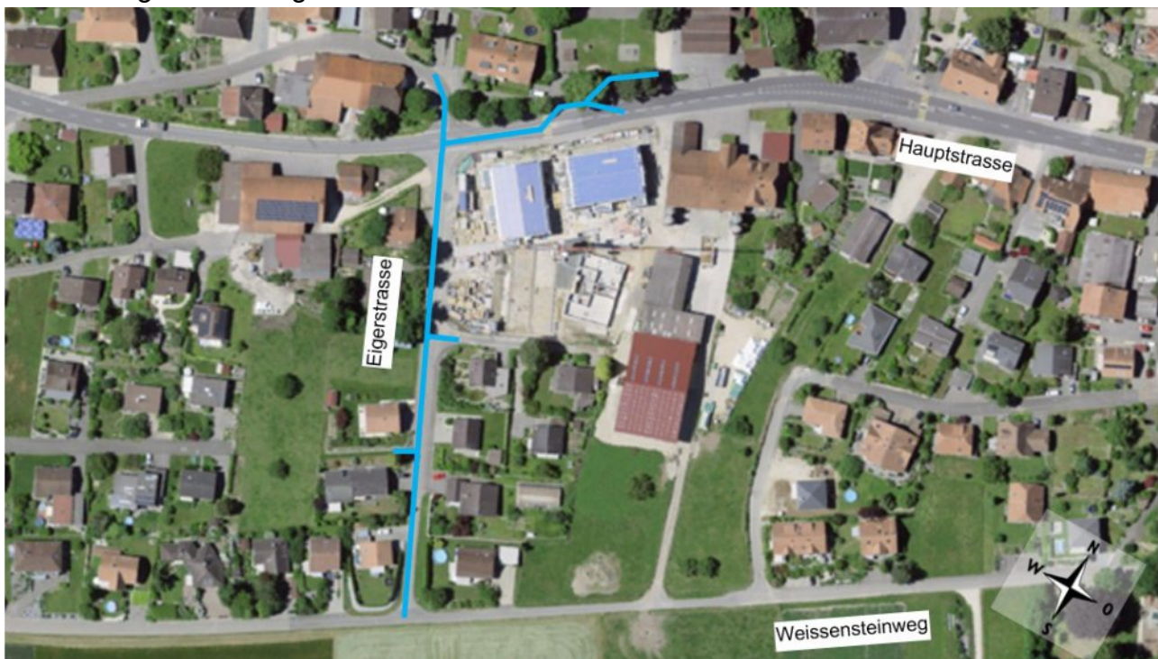
Abbildung 1, Ersatz der Trinkwasserleitung inkl. Löschschutz

Die Trinkwasserleitung in der Haupt- und Eigerstrasse muss alters- und zustandsbedingt ersetzt werden. Auf einer Länge von ca. 150 m weist die Leitung für die geforderten Löschwassermengen mit 100 mm einen zu geringen Durchmesser auf. Weitere 143 m bestehen aus einer VonRoll-Serie, welche nachweislich über Qualitätsmängel verfügt. Die Leitung verläuft entlang der Hauptstrasse teilweise auf einem privaten Grundstück. Diese Leitung wird mit dem Projekt in den öffentlichen Raum verlegt. Mit dem vorliegenden Projekt erfolgen an den nötigen Stellen eine Kalibriererweiterung sowie ein Leitungsersatz. Der Leitungsverlauf liegt teilweise innerhalb des Fahrbahnbereichs.