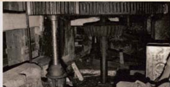
Das Getriebe unter dem Mühlenstuhl. Von hier aus werden pro Mahlgang der obere Mahlstein, der Läufer angetrieben. Die Zähne sind aus Kirschbaumholz gefertigt.